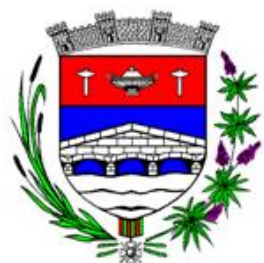
Souppes-sur-Loing Département de Seine-et-Marne Arrondissement de Fontainebleau

Direction : Benjamin POIRIER et Naty POVEDA Rue des Varennes – Rue des Mariniers (derrière la Poste) 77460 SOUPPES SUR LOING 06.80.94.98.56 OU 06.82.13.27.71 OU 09.77.84.97.14 adl@tourisme-souppes.fr